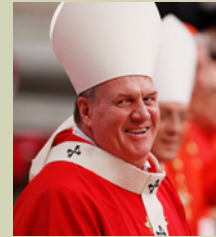
Cardinal Joseph W. Tobin, C.S.s.R. Archbishop of Newark